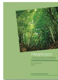
PÅRØRENDE - råd og vejledning til pårørende til mennesker med psykisk sygdom - af Jes Gerlach - PsykiatriFonden 2008