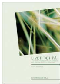
Livet tæt på - om at være pårørende til mennesker med borderline eller psykopati - af Pia Skadhede - PsykiatriFonden 2008